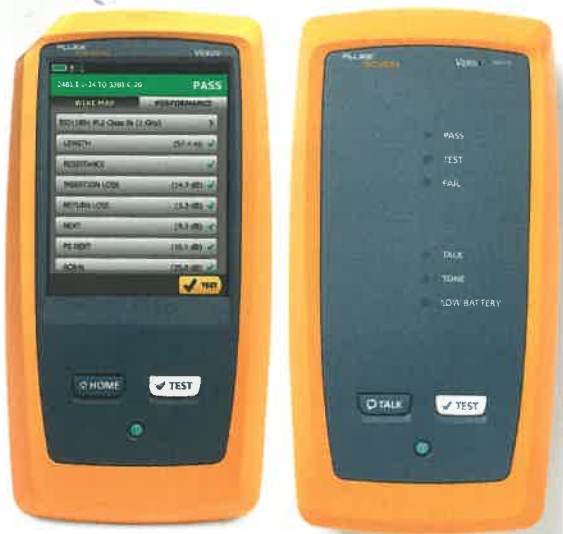
а) прибор Main б) прибор Remote