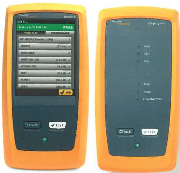
а) прибор Main б) прибор Remote