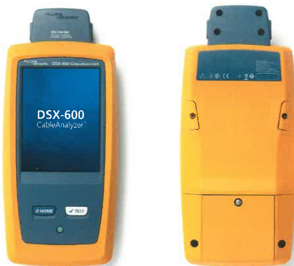
а) прибор Main

Общий вид анализаторов представлен на рисунках 1-5.