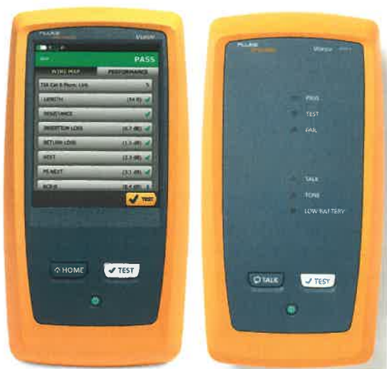
а) прибор Main б) прибор Remote