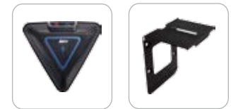
дополнительный набор микрофонов подставка eCam для монтажа камеры

* Для получения более подробной информации обратитесь на сайт www.avervcs.ru/warranty